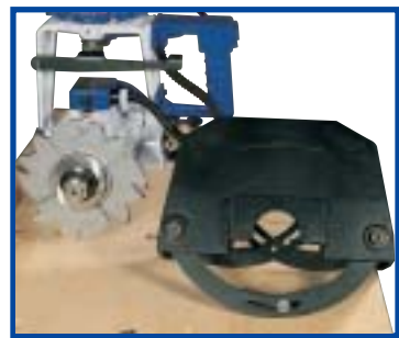
Cod. 720150130000 300 x 60 mm Protezione per frese Grooving head guard Fräser- schutzhaube Protecteur pour fraises Protección para fresas