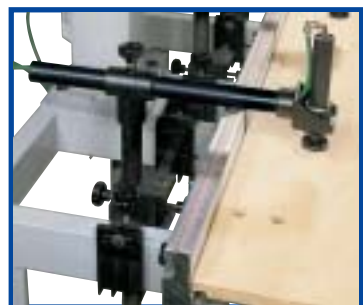
Cod. 720860564300 Alberi speciali Special spindles Verlängerte motorwelle Arbres spéciaux Ejes especiales