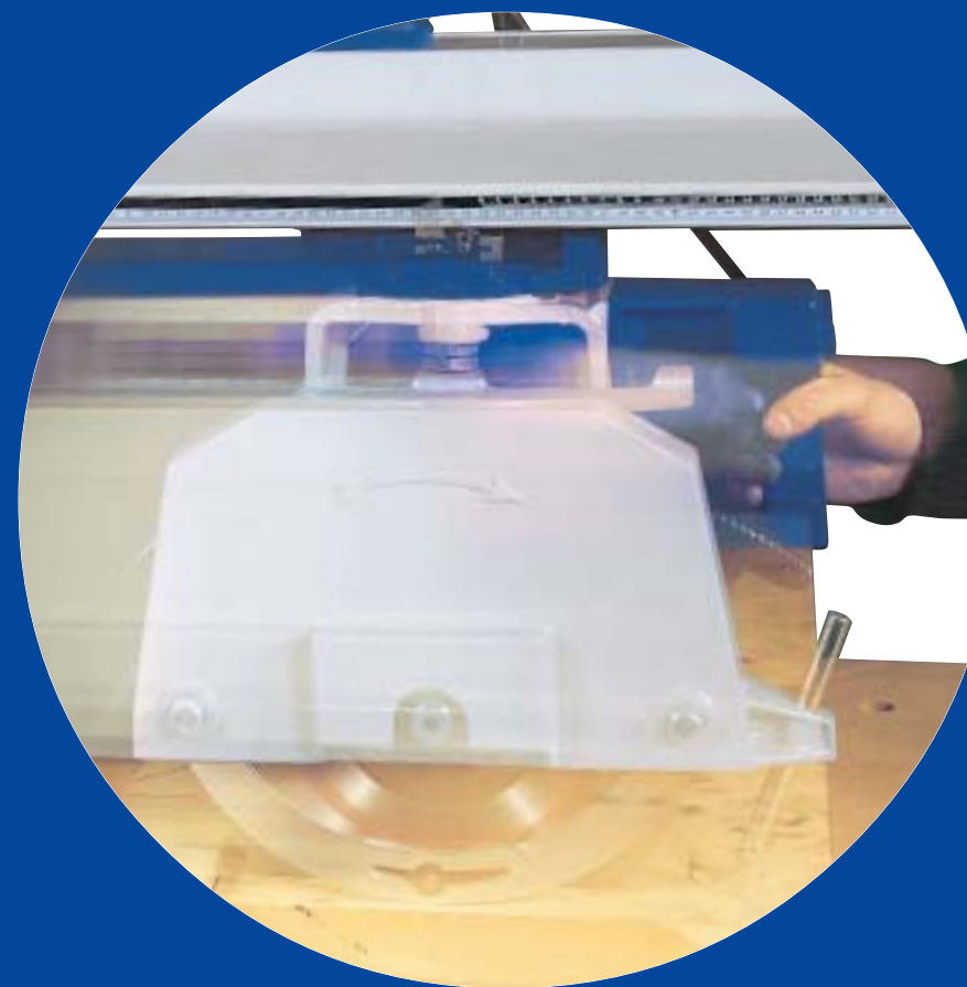
Cod. 710170080000 Ø 300 Carter Safety guard Schutzhaube Protecteur de lame Protección de disco