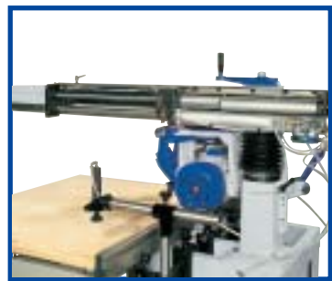
Cod. 720340630000 R 800 P3S Cod. 720340400000 R 600 P3S Avanzamento oleopneumatico Oil-pneumatic feed Ölpneum vorschub Avance oléo-pneumatique Avance oleoneumático